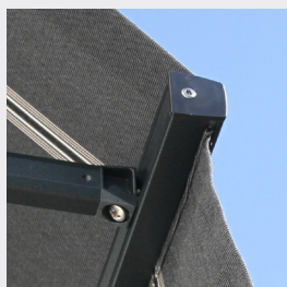
Standard frontprofil med kapp.