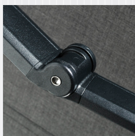
Knäled utrustad med Dyneema® band.