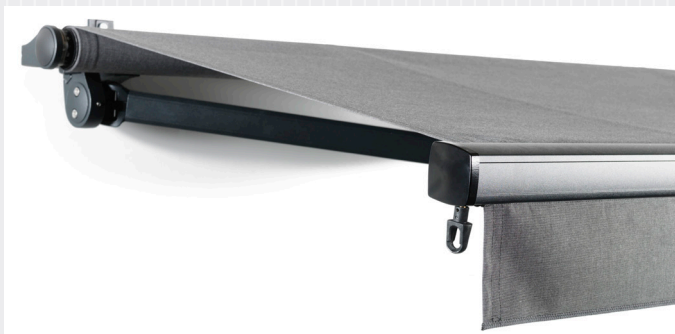
FA44 i profil