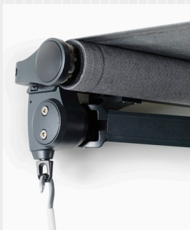
FA46 Pitch Control