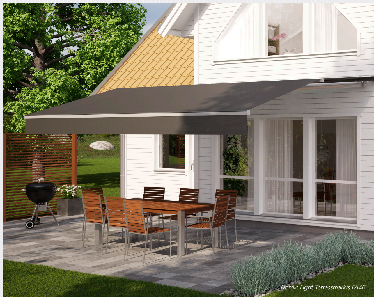
Nordic Light Terrassmarkis FA46

Smart tillval: Med motorstyrningen SmartControl kan markisen manövreras av en iPhone-app via wifi.