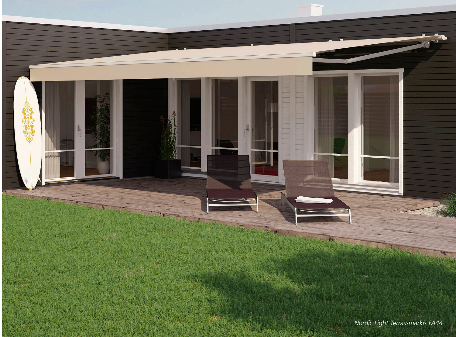
Nordic Light Terrassmarkis FA44