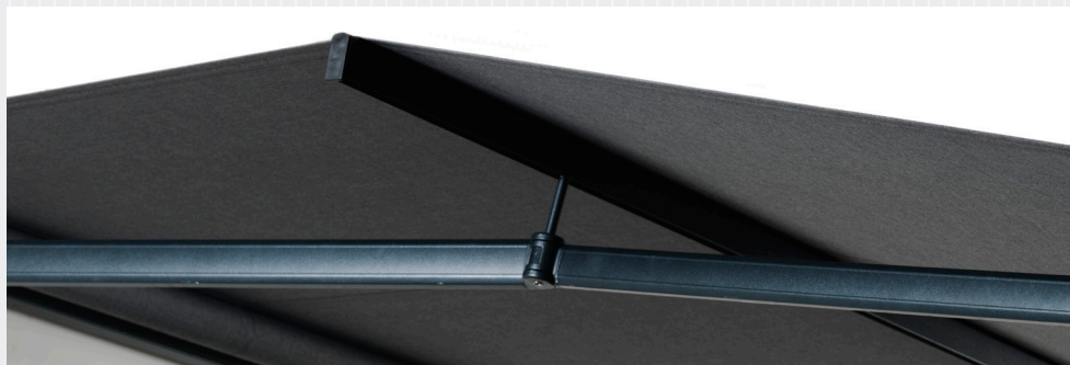
FA46 – Extra st h jd med dukbalk