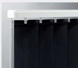
Med vridstång och lina