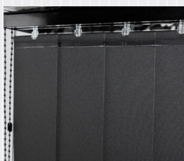
Skena, reglageliner och beslag i svart utförande.