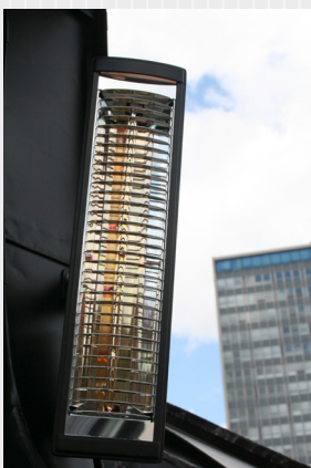
Rio kan monteras horisontellt eller vertikalt.