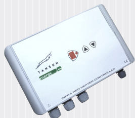
Styrning finns i 4 kW eller 6kW.